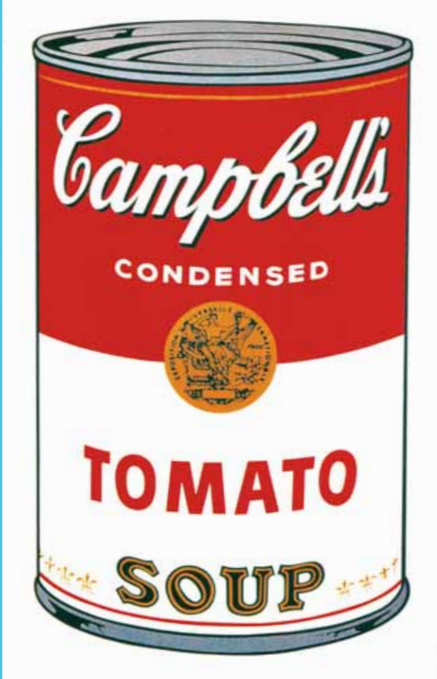
Andy Warhol, Campbell's Soup

Weer een andere kant van zijn kunstenaarschap: Andy Warhol ontdekte de later invloedrijke rockgroup The Velvet Underground.