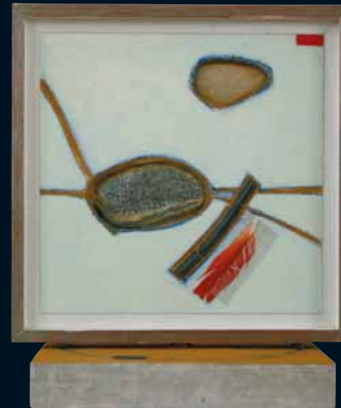
Draaibaar paneel, 30x30 cm, titel: „Sporen“

Het materiaal wordt ingezet als een vanzelfsprekend onderdeel van het beeld, en niet als zichzelf herkenbaar. Zo worden pauwenveren van hun paarse oog ontdaan omdat ze anders een te overheersend herkenbaar beeld vormen.