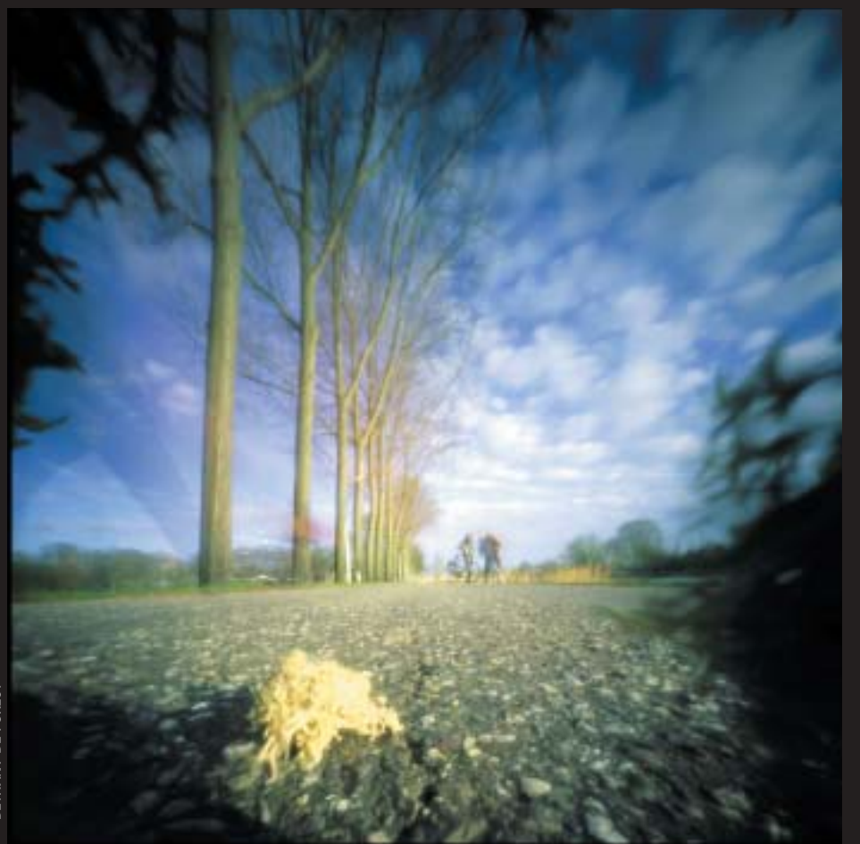
BETHANY DE FOREST

Bethany de Forest fotografeert veel met behulp van een pinhole camera, waarbij letterlijk door een gaatje, zonder lens, wordt gefotografeerd. Haar camera's zijn dan ook door haarzelf gemaakt en soms niet groter dan een luciferdoosje. "Het uitvergroten van details en kleine wezens, zoals insecten, krabben of vissen vind ik interessant. Het is leuk om beelden in een andere context te plaatsen en te kijken wat er gebeurt". Zij bouwt daarvoor maquettes van suikerklontjes, spiegeltjes waar zij insecten of objectjes in plaatst. De camera, een kunstwerkje op zich, is vaak zelf onderdeel van het decor. "Het is bijzonder boeiend om de wereld vanuit een heel ander standpunt te laten zien." ▶